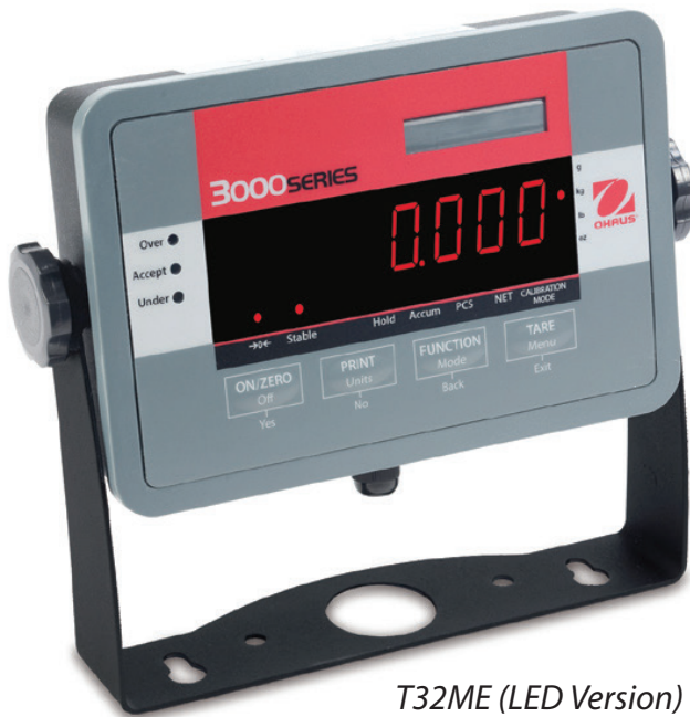
T32ME (LED Version)