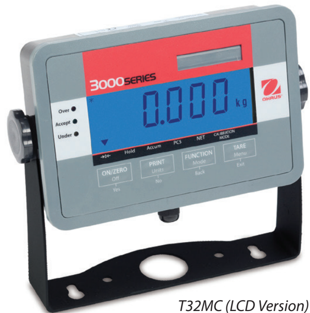
T32MC (LCD Version)