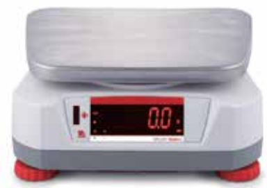
Rückwärtiges Display mit integriertem berührungslosen Sensor