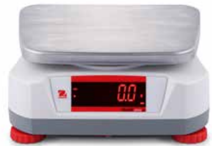
Display an der Rückseite